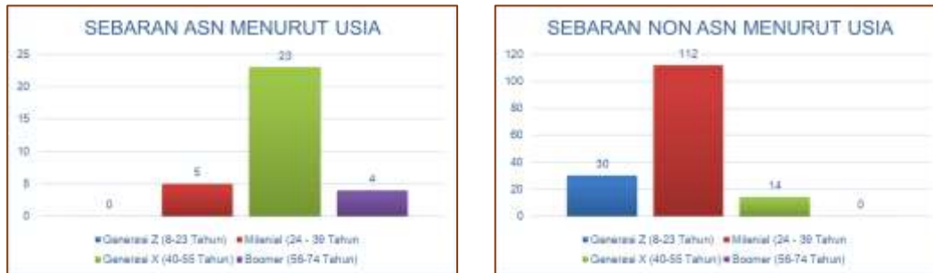
Gambar 3 Sebaran ASN dan Non ASN Berdasarkan Usia

Komposisi usia yang didominasi oleh generasi milenial memberikan banyak keuntungan dari sisi penggunaan teknologi dan keterbukaan akan perubahan yang dinamis.