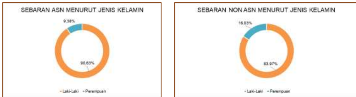
Gambar 1 Sebaran ASN dan Non ASN Berdasarkan Jenis Kelamin

Dalam menjalankan tugas dan fungsinya organisasi Badan Penanggulangan Bencana Daerah Kabupaten Bantul didukung dengan sumberdaya manusia sejumlah 188 personil dengan rincian 32 orang berstatus ASN dan 156 personil Non ASN. Detail sebaran personil berdasarkan jenis kelamin dapat dilihat pada gambar berikut