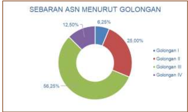
Gambar 5 Sebaran ASN Berdasarkan Golongan