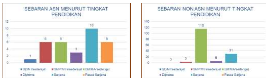
Gambar 4 Sebaran ASN dan Non ASN Berdasarkan Tingkat Pendidikan

Dari sisi tingkat pendidikan, komposisi SDM di BPBD Kabupaten Bantul sudah cukup baik. Masih terdapat 5,32% personil berpendidikan dasar, namun hal tersebut dapat tertutupi oleh komposisi lainnya dimana 64,89% sudah berpendidikan sekolah menengah dan 29,79% berpendidikan tinggi. Lebih detainya dapat dilihat dalam gambar 4 berikut.